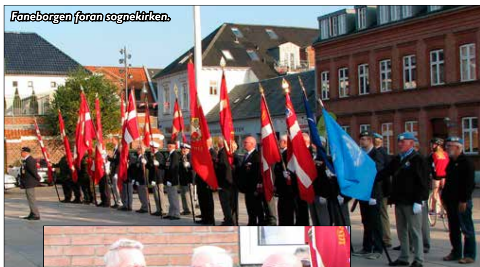
Faneborgen foran sognekirken.