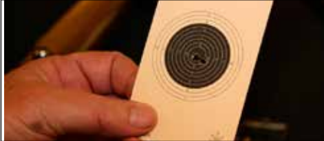
Den nye redaktør tjekker skydeskiver