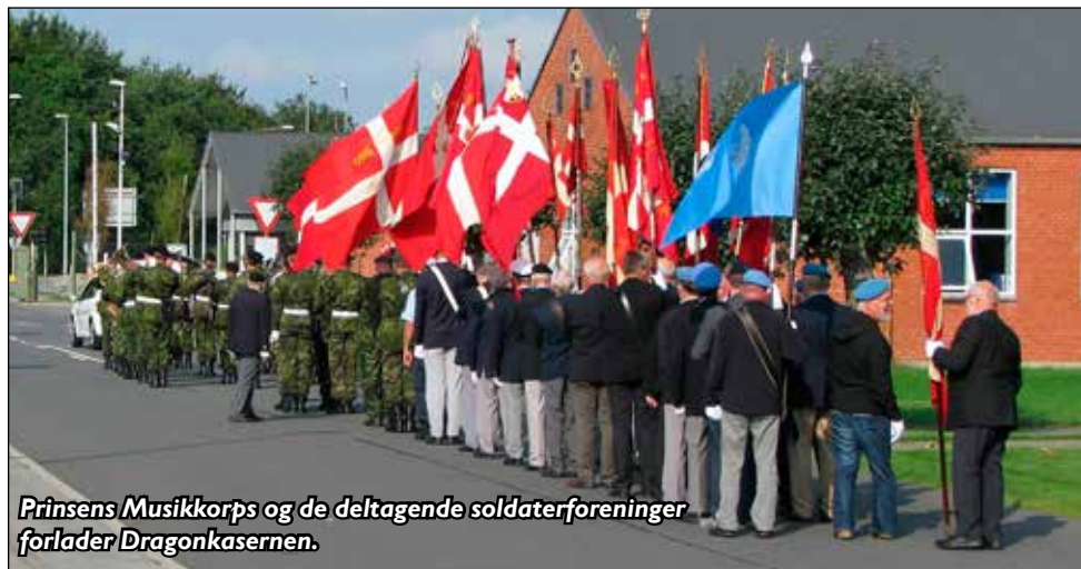
Prinsens Musikkorps og de deltagende soldaterforeninger forlader Dragonkasernen.