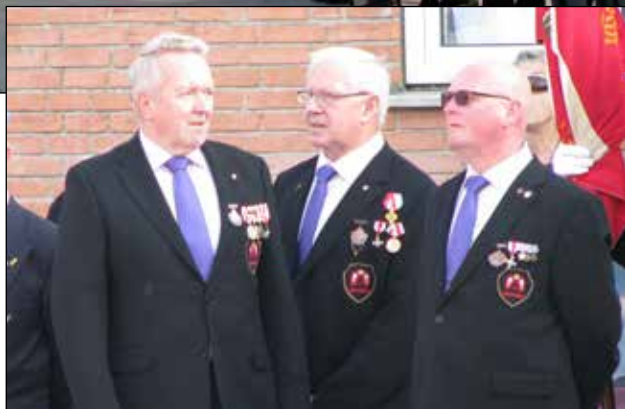
Tre mandhaftige brødre ...mon det var dem forsidepigen kiggede efter?