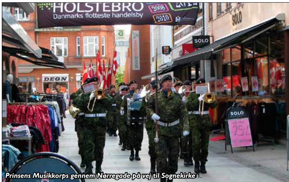
Prinsens Musikkorps gennem Nørregade på vej til Sognekirke.